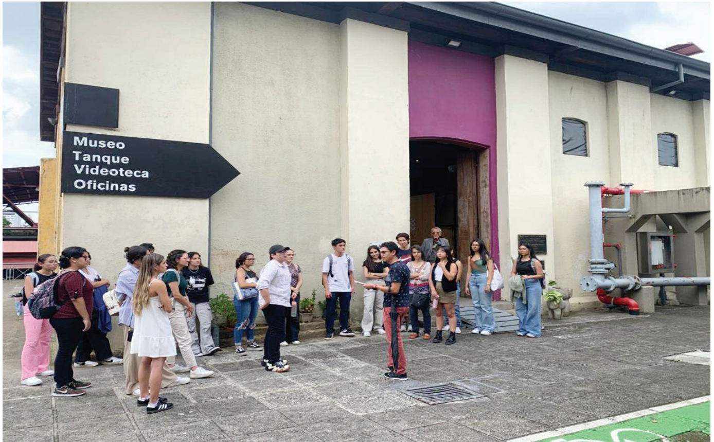
Museo de Arte y Diseño Contemporáneo, San José, CR. Museum of Art and Design Contemporary, San José, CR.